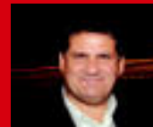
Domingo Palermitti Cultura y Capacitación

T ras el exitoso primer cuatrimestre con la entrega de certificados a más de 150 egresados, finalizó en diciembre el segundo nivel del curso de Auxiliar en Sistema de Seguridad Social iniciado en agosto, que convocó a 127 participantes. Con el objetivo de capacitar a los compañeros a fin de que conozcan las contingencias sociales y el amparo que brinda el Sistema de Seguridad Social, nuestro sindicato se enorgullece una vez más por la gran con-